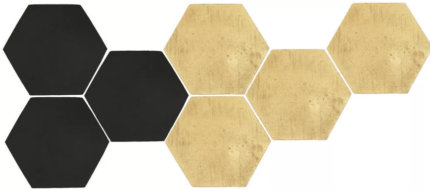
Terreal Italia, esagoni in terracotta Nero Lavico e Oro Brillante

Protagonisti di una intera sala espositiva saranno gli esagoni in terracotta Nero Lavico e Oro Brillante di Terreal Italia applicati a parete, in una posizione inedita e al tempo stesso contemporanea per un materiale così tradizionale, che si riscopre in grado di dialogare con le visioni più moderne di architetti e designer.