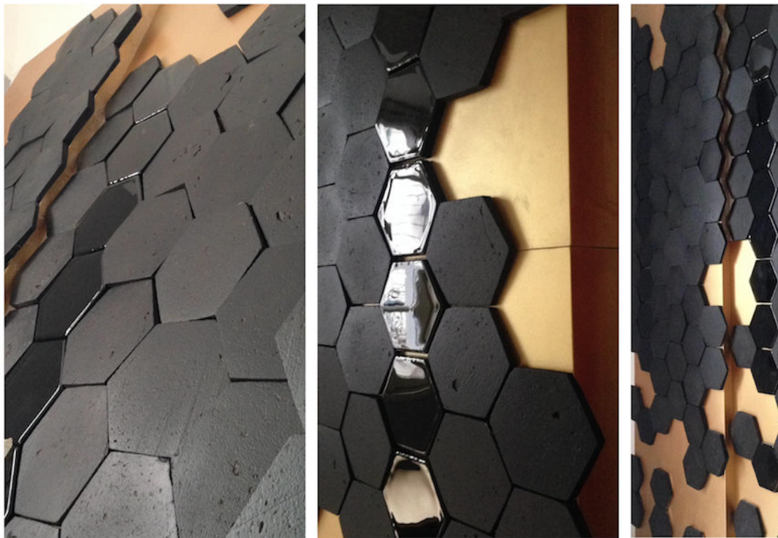
La linea Habitat nell'installazione realizzata per il Fuori Salone 2019 di Milano

La nuovissima linea Habitat sarà presentata all'evento MaterialiCasaAroundSh un'installazione multisensoriale che esplora gli usi non convenzionali della materia svolgerà in occasione del Fuorisalone 2019 di Milano .