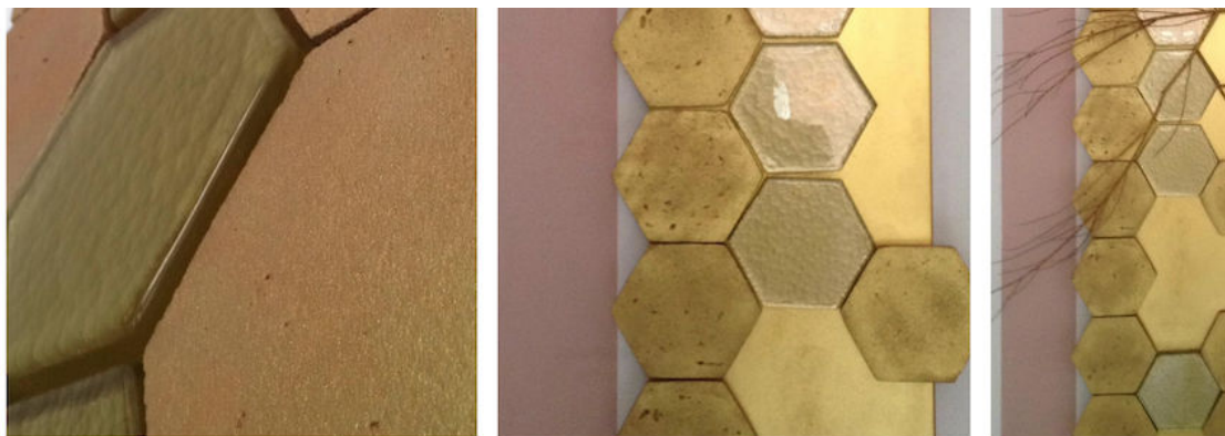
La linea Habitat nell'installazione realizzata per il Fuori Salone 2019 di Milano

Un prestigioso appartamento d'epoca rivisitato fa da cornice ad un percorso immergevole con volumi e percezioni e accende i riflettori sulle tendenze materiche dell'architettura contemporanea.