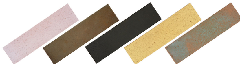
Da sinistra le varianti di Habitat: Bianco di Carrara, Corten, Nero Lavico, Oro Brillante, Rosa del Deserto (foto Terreal Italia)

«Il progetto è stato sviluppato all'interno dei laboratori ricerca e sviluppo di SanMarco in un dialogo continuo col mondo della progettazione da cui provengono le sollecitazioni verso nuove forme e utilizzi della terracotta, in linea con le moderne esigenze estetiche e funzionali. Siamo certamente di fronte a una svolta decisiva nell'impiego del faccia a vista: non più "semplicemente" mattone o listello, ma il concetto contemporaneo nell'uso diffuso della terracotta, materiale che si presta ad usi alternativi nell'interior assicurando tra l'altro una grande libertà di posa, destinata anche al fai da te».