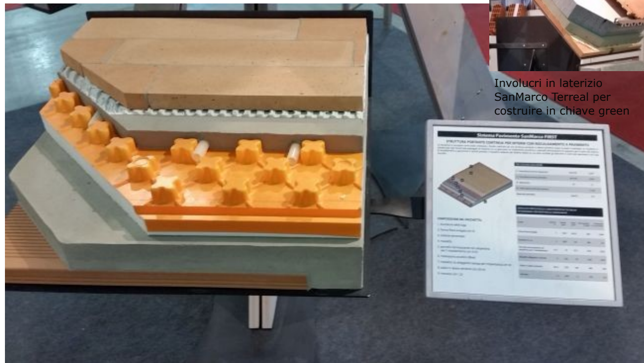
Involucri in laterizio SanMarco Terreal per costruire in chiave green

SanMarco presenterà a Klimahouse i nuovi sistemi di involucro in laterizio particolarmente performanti a livello di risparmio energetico, estetica e tenuta strutturale.